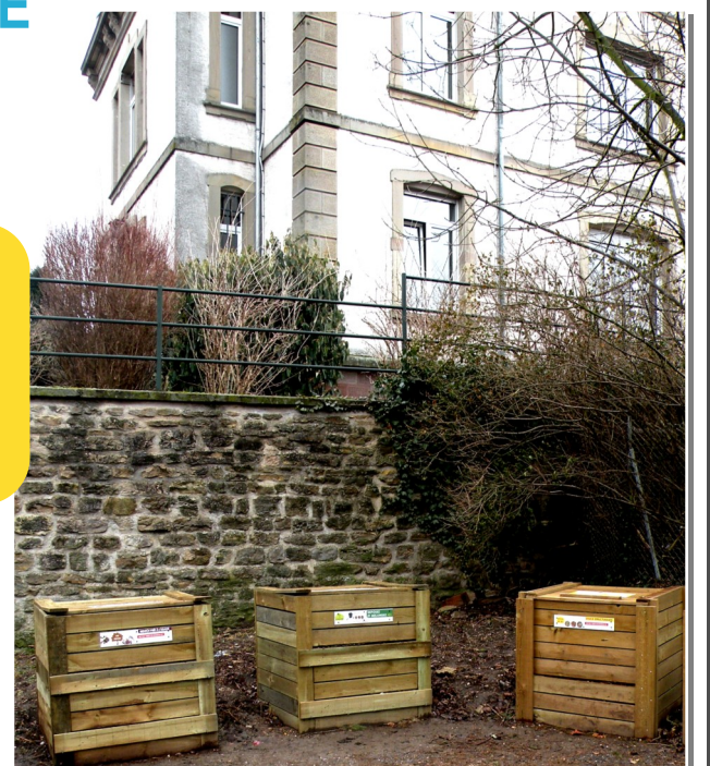
Résidence La Fontaine, Sarrebourg

Fort de la réussite de ces 2 opérations pilotes, l'objectif, en 2012, est de développer cette action sur l'ensemble du territoire de l'Arrondissement de Sarrebourg en lien avec les habitants et en partenariat avec les syndicats.