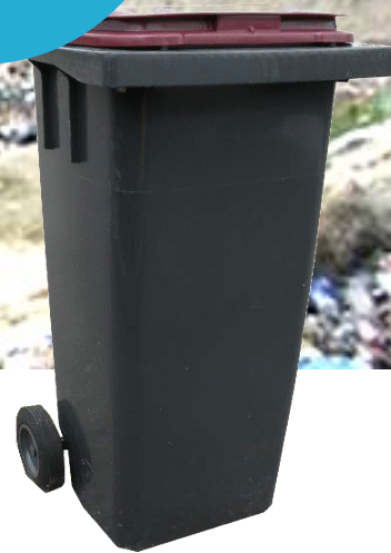
Centre d'Enfouissement des Déchets Ultimes de l'Arrondissement de Sarrebourg, à Hesse

-54% de déchets enfouis entre 2009 et 2011